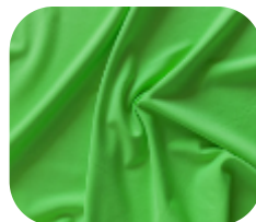
#185725 | SFLEX FLUORESCENTE VERDE CITRICO