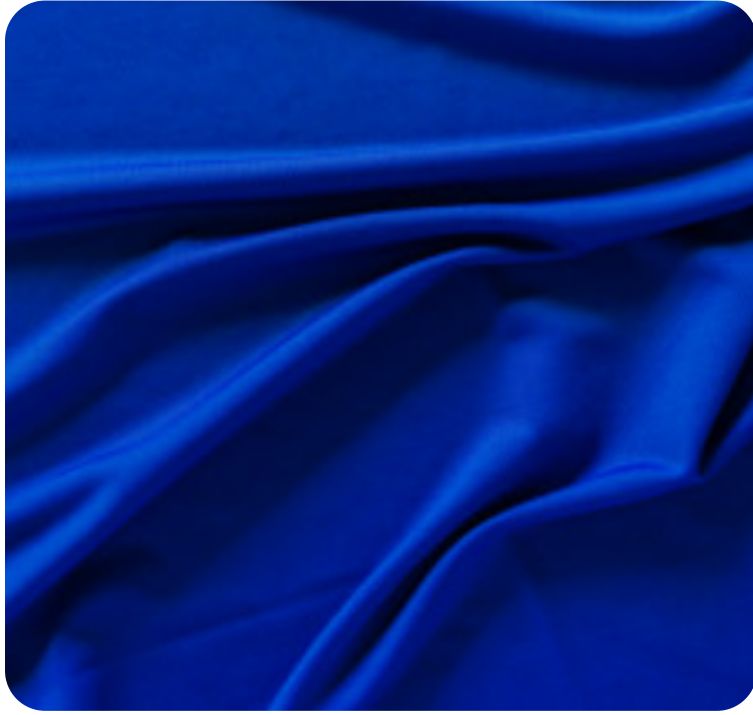
#1812704 | SFLEX ROYAL