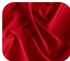
#183471 | SFLEX VERMELHO