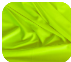
#185724 | SFLEX FLUORESCENTE AMARELO LIMAO