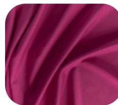
#1811897 | SFLEX AZALÉIA