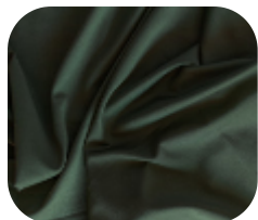
#18401455 | SFLEX VERDE