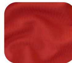
#1811935 | SFLEX TELHA