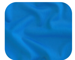
#1812331 | SFLEX BLUE