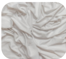
#270001 | LIGHT FLEX BRANCO