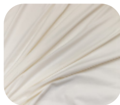
#275052 | LIGHT FLEX LAVADO