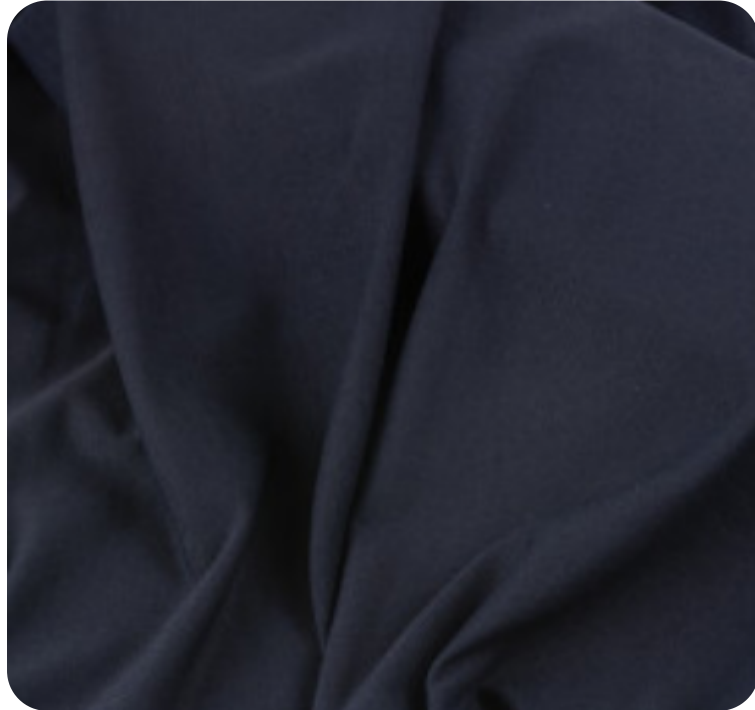
#270032 | LIGHT FLEX PRETO