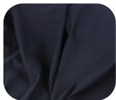
#270032 | LIGHT FLEX PRETO

Com alto fator de proteção UV (FPS 50+), utiliza fibras de poliamida que são termicamente mais confortáveis e duráveis.