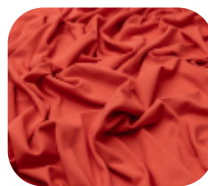
#6320440 | CARMITAFLEX TANGERINA