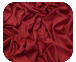
#6360188 | CARMITAFLEX DIVA