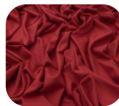
#6360188 | CARMITAFLEX DIVA