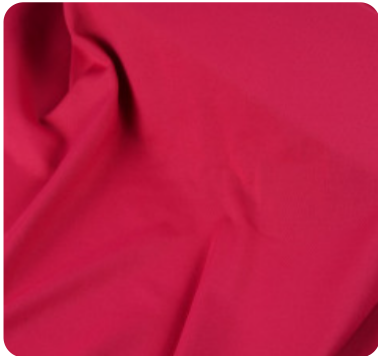
#637489 | CARMITAFLEX PINK