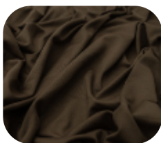
#636641 | CARMITAFLEX MARROM