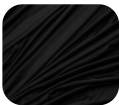
#630032 | CARMITAFLEX PRETO