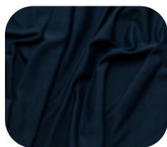
#6360205 | CARMITAFLEX MARINHO