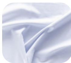
#630001 | CARMITAFLEX BRANCO