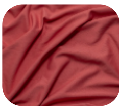
#638949 | CARMITAFLEX CORAL