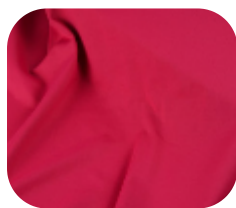
#637489 | CARMITAFLEX PINK

Versátil e com toque macio, perfeito para criar peças leves e confortáveis.