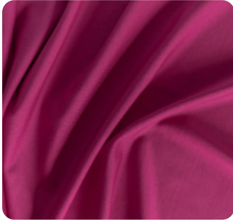
#9111897 | SUPLEX 350 AZALÉIA