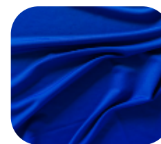
#9112704 | SUPLEX 350 ROYAL