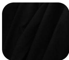
#10030032 | SUPLEX LISBOA PRETO

Utiliza fibras de poliamida que são termicamente mais confortáveis e duráveis.