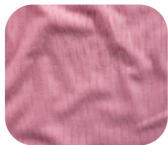
#109312622 | CLAIR TRABALHADO I ROSA CHICLETE