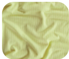
#109313643 | CLAIR TRABALHADO I AMARELO