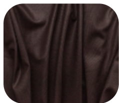
#1106723SF | SFLEX FELPADO CHINTS MARROM