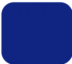
#1108417SF | SFLEX FELPADO CHINTS ROYAL