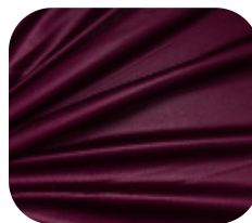
#11015376SF | SFLEX FELPADO CHINTS MARCELIA