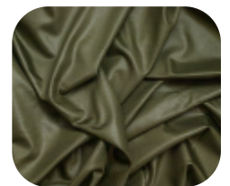
#110401455SF | SFLEX FELPADO CHINTS VERDE