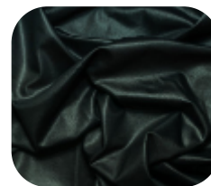
#11036140SF | SFLEX FELPADO CHINTS CHUMBO