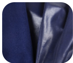
#11012714SF | SFLEX FELPADO CHINTS MARINHO

Com brilho intenso e marcante, se moldando perfeitamente ao corpo, o cirre se tornou indispensável no guarda roupa feminino.