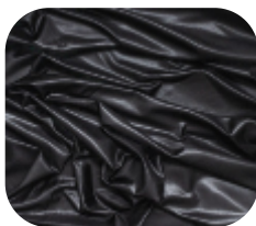
#1100032SF | SFLEX FELPADO CHINTS PRETO