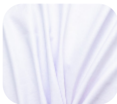
#1100001SF | SFLEX FELPADO CHINTS BRANCO