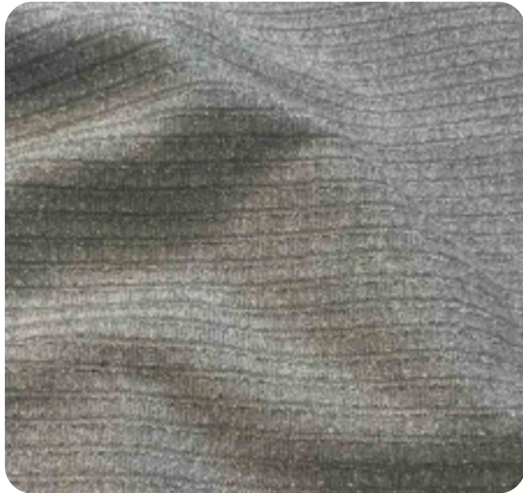
#11355032 | CANELADO LUREX PRATA