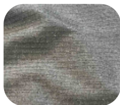
#11355032 | CANELADO LUREX PRATA

O lurex possui um toque sofisticado em fios metálicos, proporcionando elegância e glamour na composição de suas peças.