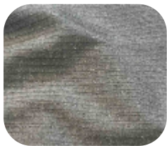
#11355032 | CANELADO LUREX PRATA

O lurex possui um toque sofisticado em fios metálicos, proporcionando elegância e glamour na composição de suas peças.