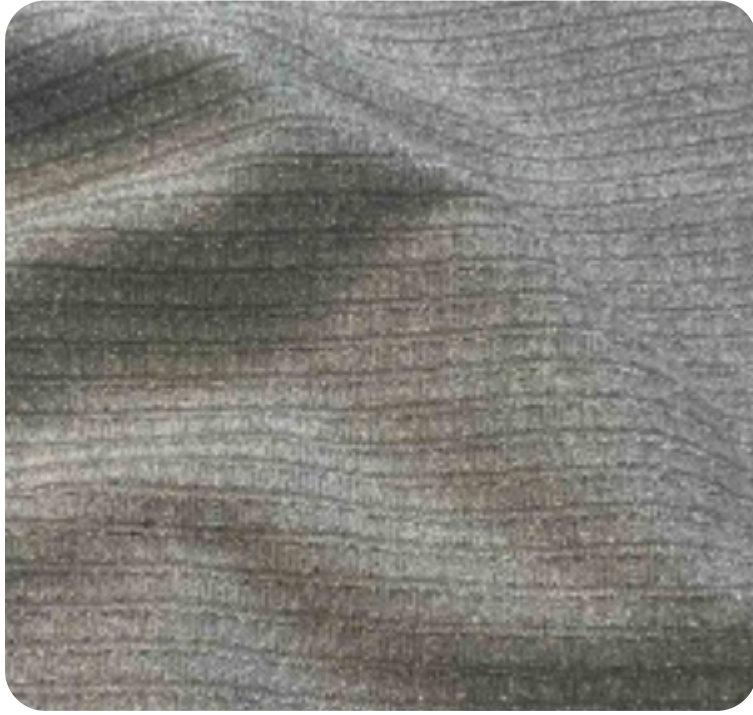
#11355032 | CANELADO LUREX PRATA