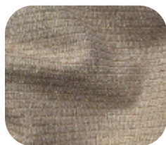
#11395032 | CANELADO LUREX DOURADO E PRATA

O lurex possui um toque sofisticado em fios metálicos, proporcionando elegância e glamour na composição de suas peças.