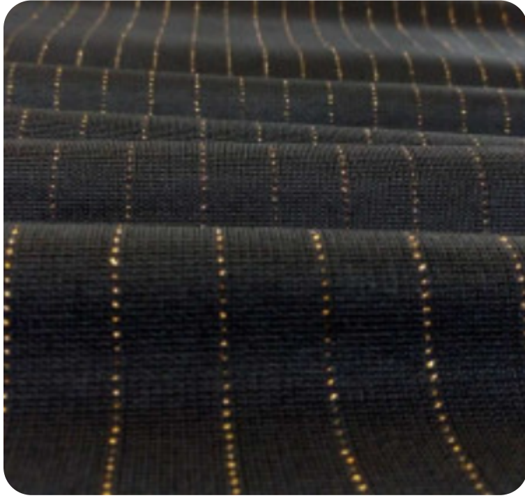
#11555032 | RISCA DE GIZ LUREX DOURADO