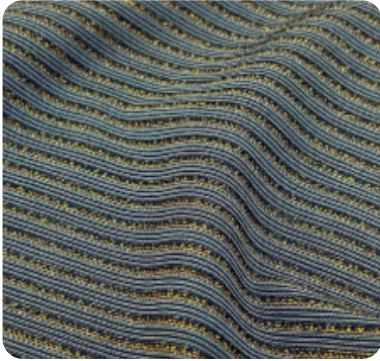
#11855032 | LISTRADO LUREX II DOURADO/MARINHO