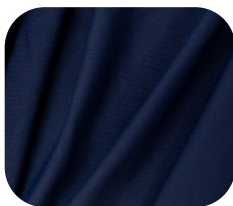
#13363139 | PRO-TWIST MARINHO