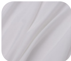
#1825032 | AGILE OFFWHITE