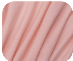
#18242900 | AGILE ROSE