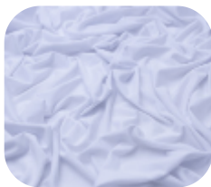
#1820001 | AGILE BRANCO