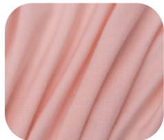
#18242900 | AGILE ROSE