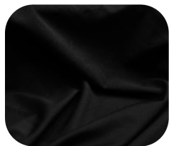
#1820032 | AGILE PRETO