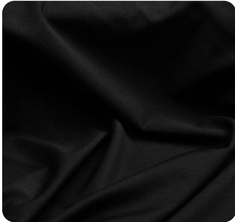
#1820032 | AGILE PRETO