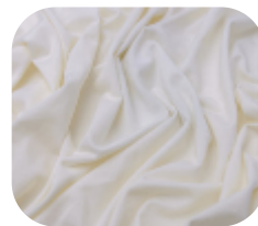
#18237209 | AGILE DESERTO