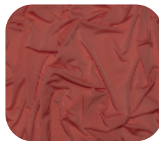
#18220143 | AGILE CORAL