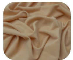
#18238792 | AGILE BEGE