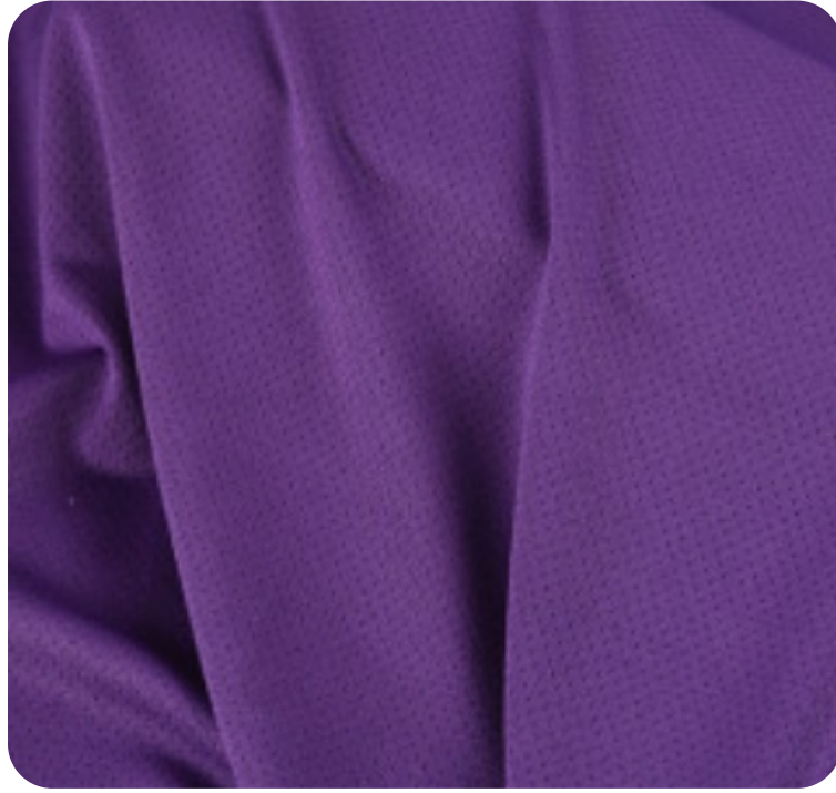
#22915333 | DRY FLEX ROXO