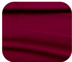
#22911507 | DRY FLEX PINK