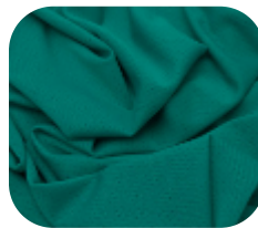
#22918428 | DRY FLEX VERDE JADE