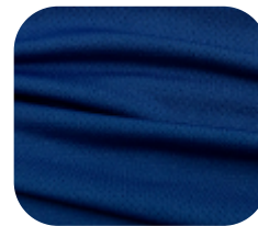
#22935567 | DRY FLEX ROYAL