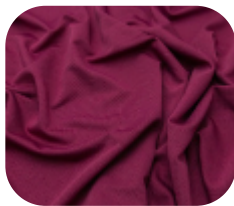
#22915334 | DRY FLEX BORDO