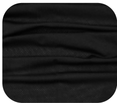
#2290032 | DRY FLEX PRETO