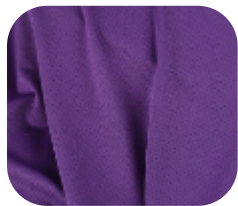
#22915333 | DRY FLEX ROXO

O dry é uma malha mais esportiva, pois sua estrutura permite conforto mesmo com a alta transpiração. Possui durabilidade e caimento.