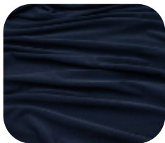
#22912696 | DRY FLEX MARINHO