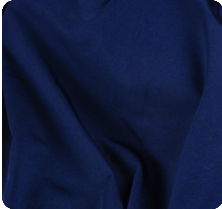
#26351610 | DIAMOND POWER MARINHO