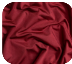
#26324440 | DIAMOND POWER BORDO