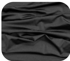
#2630032 | DIAMOND POWER PRETO