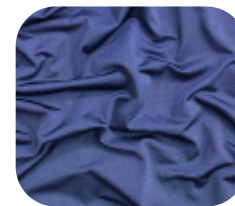
#26350321 | DIAMOND POWER MARINHO