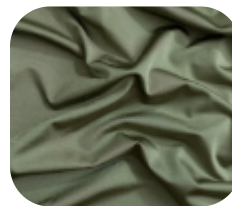
#26336170 | DIAMOND POWER ERVA DOCE