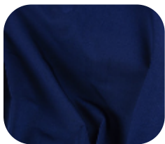
#26351610 | DIAMOND POWER MARINHO

O Diamond Power é macio e possui muita elasticidade.