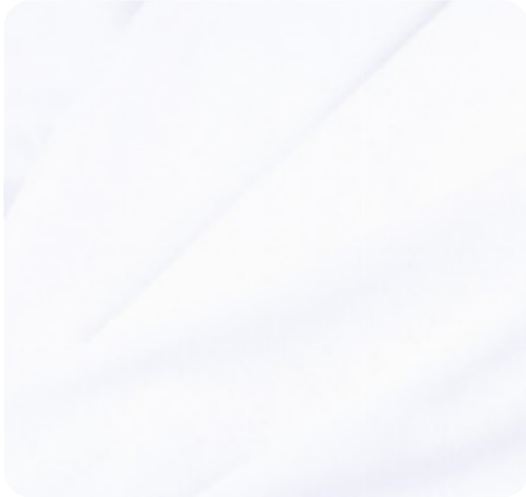
#3060001 | MOLETINHO 100% POLIÉSTER BRANCO