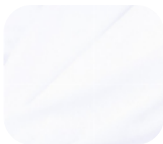
#3060001 | MOLETINHO 100% POLIÉSTER BRANCO

O moletinho é uma malha muito parecida com o moletom, porém eles são mais finos, com mais caimento e não são tão quentes, podendo ser usado em dias mais amenos.