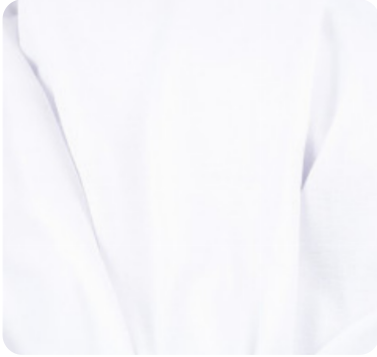
#3080001 | MALHA FLAT BRANCO