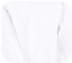
#3080001 | MALHA FLAT BRANCO

Com toque macio e excelente caimento, a Malha Flat é perfeita para confecção de peças leves.