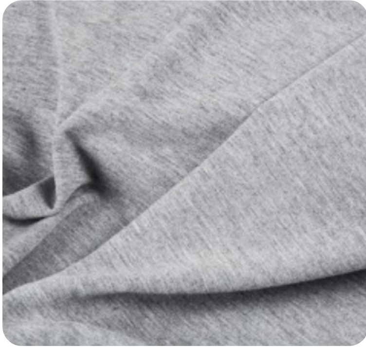
#3355009 | MOLICOTTON MESCLA