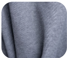
#0403 | RIBANA 2X1 30/1 PV MESCLA 2 CABOS