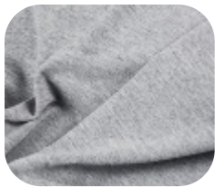
#3355009 | MOLICOTTON MESCLA

Produto ideal para confeccionar peças macias e confortáveis.