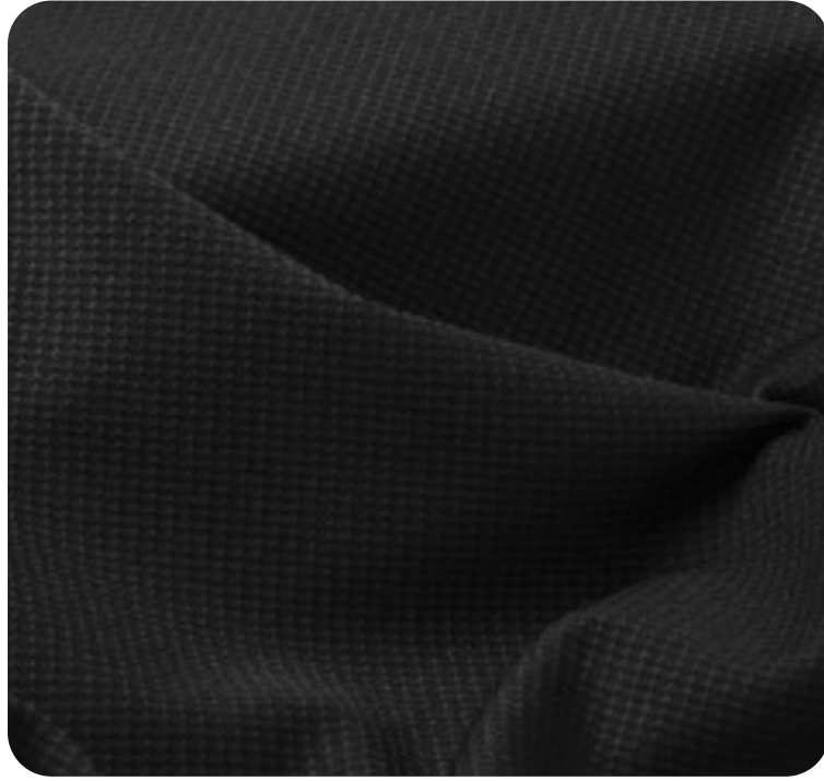
#3690032F | STIK FINE FELPADO PRETO