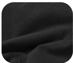
#5120032F | ROPE 2 FELPADO PRETO

O Rope é um produto diferenciado, com toque macio, desenvolvido com a mais alta tecnologia para quem busca confeccionar tanto moda fitness quanto casual.