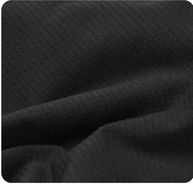
#5120032F | ROPE 2 FELPADO PRETO