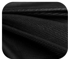
#5330032S | SFLEX LACE 2 CHINTS PRETO

Sflex Lace - Elasticidade, toque macio, qualidade.