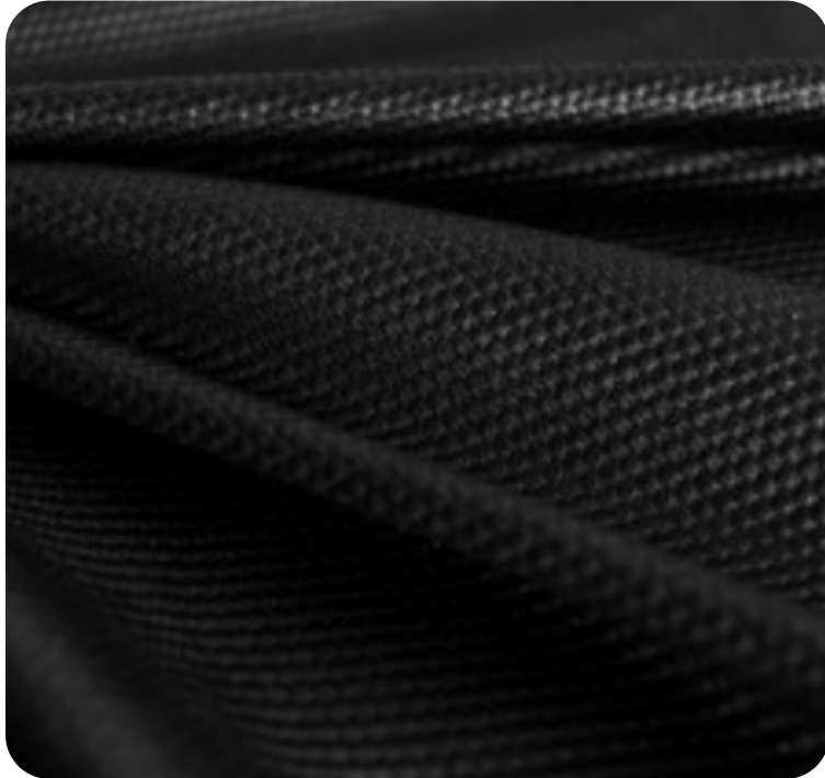
#5330032S | SFLEX LACE 2 CHINTS PRETO