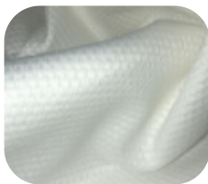
#5335032S | SFLEX LACE 2 CHINTS OFFWHITE