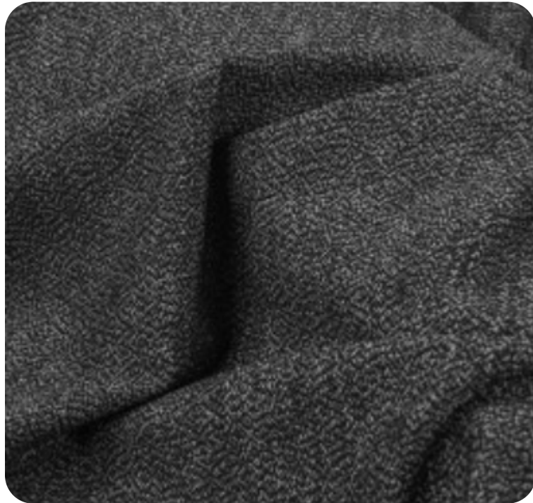
#7285032 | CREP MESCLA RAJADO