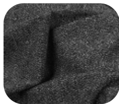
#7285032 | CREP MESCLA RAJADO

Encorpado, com caimento e boa elasticidade.