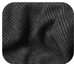
#7515032 | SKIRT XADREZ MESCLA/PRETO II

Independente da estação, o xadrez está sempre em alta. Em diferentes padronagens, pode ser usado tanto na moda casual quanto na mais sofisticada. Não importa qual seja seu estilo, ele é peça chave no seu guarda-roupa.