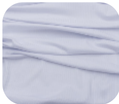
#7860001 | CLAIR BRANCO