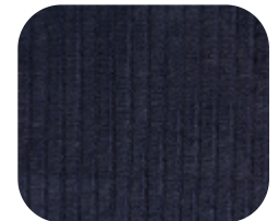
#78610783 | CLAIR MARINHO