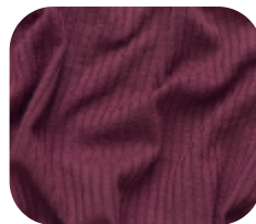
#78621378 | CLAIR BORDO