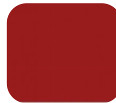
#78658324 | CLAIR VERMELHO