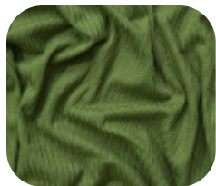
#78611910 | CLAIR VERDE PISTACHE