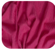
#78644738 | CLAIR CEREJA