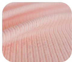
#78632812 | CLAIR ROSÊ