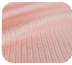
#78632812 | CLAIR ROSÊ