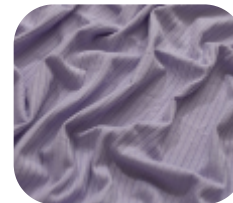
#78610277 | CLAIR LILAS