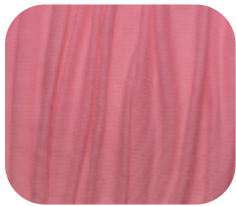
#78634940 | CLAIR PINK FLUOR