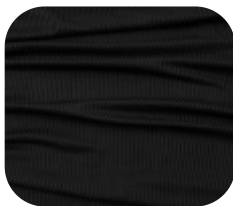
#7860032 | CLAIR PRETO