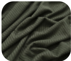
#78673843 | CLAIR VERDE