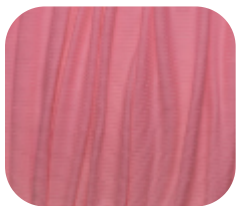
#78634940 | CLAIR PINK FLUOR