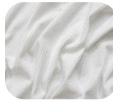
#7865032 | CLAIR OFFWHITE