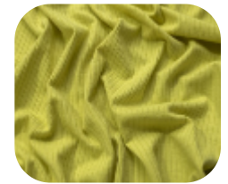
#78671408 | CLAIR CITRONELA