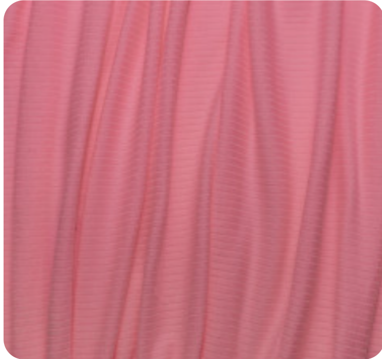
#78634940 | CLAIR PINK FLUOR