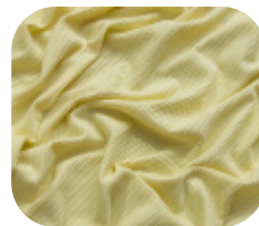
#78622389 | CLAIR AMARELO