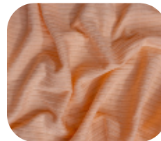
#78610274 | CLAIR LARANJA FLUOR