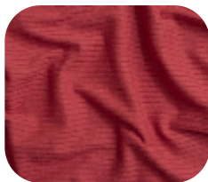
#786191760 | CLAIR RED