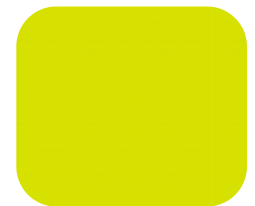
#78671408 | CLAIR CITRONELA