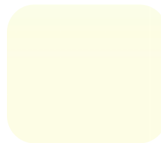
#7865032 | CLAIR OFFWHITE