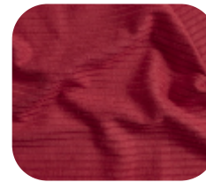
#78658324 | CLAIR VERMELHO