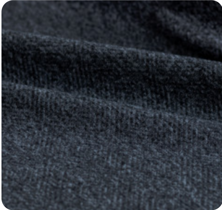
#8025032 | BONE VI MESCLA CLARO