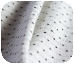
#8125032 | BALL OFFWHITE

O Ball é perfeito para criar peças que fiquem mais soltinhas ao corpo, garantindo assim mais conforto ao dia a dia.