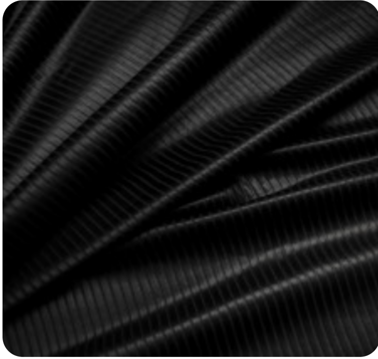
#8970032S | CANELADO CHINTS PRETO