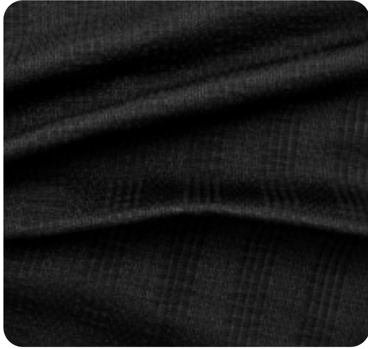
#9780032 | SCRIM PRETO