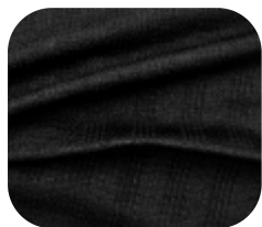
#9780032 | SCRIM PRETO

O Scrim é um produto diferenciado, desenvolvido com a mais alta tecnologia para quem busca confeccionar tanto moda fitness quanto casual.