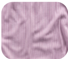
#109313644 | CLAIR TRABALHADO I ROSA BEBÊ