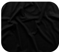
#10930032 | CLAIR TRABALHADO I PRETO