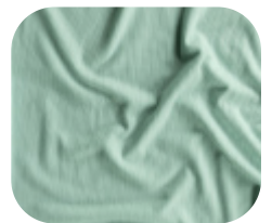
#109312623 | CLAIR TRABALHADO I VERDE CLARO