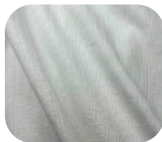
#10935032 | CLAIR TRABALHADO I OFFWHITE