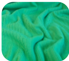
#109314011 | CLAIR TRABALHADO I VERDE