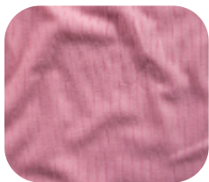
#109312622 | CLAIR TRABALHADO I ROSA CHICLETE