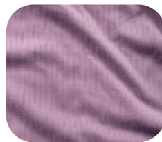
#109312617 | CLAIR TRABALHADO I LAVANDA