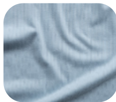
#109312616 | CLAIR TRABALHADO I AZUL BEBÊ