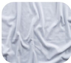
#10930001 | CLAIR TRABALHADO I BRANCO