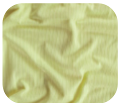
#109313643 | CLAIR TRABALHADO I AMARELO