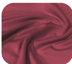
#1101.1003 | SUPREME III VERMELHO TERRA