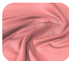
#1101.2003 | SUPREME III LARANJA CORAL