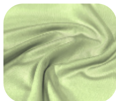
#1101.4006 | SUPREME III VERDE CHÁ