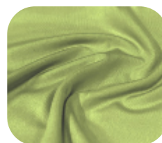
#1101.4005 | SUPREME III VERDE ABACATE