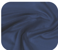
#1101.5002 | SUPREME III AZUL MARINHO