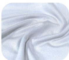
#1101.0001 | SUPREME III BRANCO