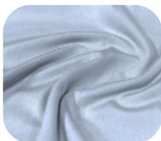
#1101.5003 | SUPREME III AZUL CÉU