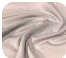
#1101.9002 | SUPREME III BEGE AREIA