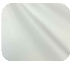
#1101.0002 | SUPREME III SUBLIMAÇÃO OFFWHITE