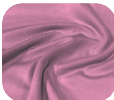
#1101.7002 | SUPREME III ROSA CHÁ