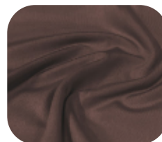
#1101.9006 | SUPREME III MARROM CAFÉ