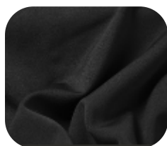
#1101.0032 | SUPREME III PRETO

O SUPREME III é uma malha encorpada e flexível, com toque macio e acabamento sofisticado. Sua elasticidade proporciona ajuste perfeito ao corpo, garantindo conforto e liberdade de movimento.