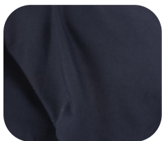
#1330032 | PRO-TWIST PRETO

Com alto fator de proteção UV (FPS 50+), utiliza fibras de poliamida que são termicamente mais confortáveis e duráveis.