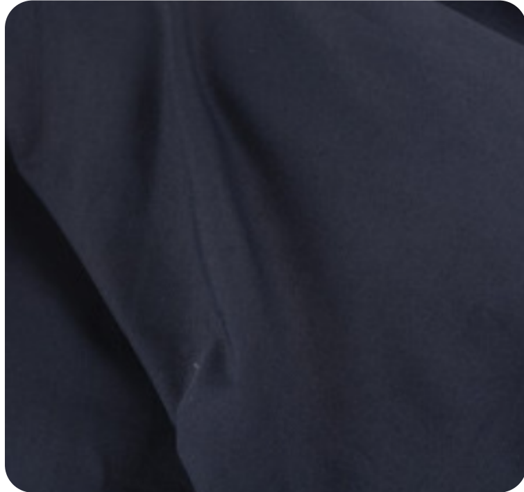
#1330032 | PRO-TWIST PRETO