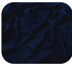
#1386721 | ITI WOOLUE MARINHO