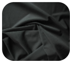
#13813762 | ITI WOOLUE CHUMBO