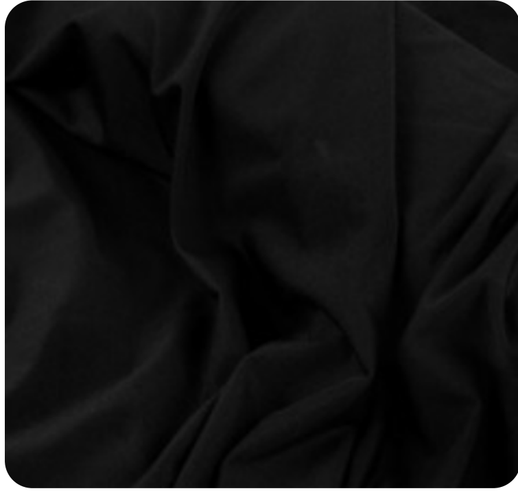
#1380032 | ITI WOOLUE PRETO