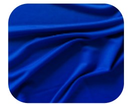
#13813753 | ITI WOOLUE ROYAL