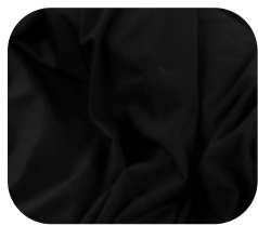
#1380032 | ITI WOOLUE PRETO

Com elasticidade e toque macio, nosso lti Woolue é perfeito para sublimação (nas cores branco e natural) e para confecção de peças leves.