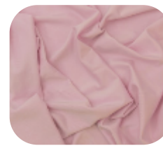
#13813752 | ITI WOOLUE ROSA