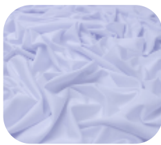
#1380001 | ITI WOOLUE BRANCO