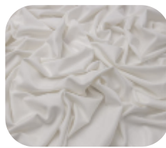
#1380002 | ITI WOOLUE NATURAL