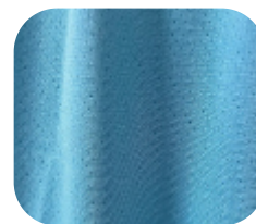
#16321106 | DRY POLIÉSTER AZUL CÉU