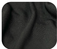
#1630032 | DRY POLIÉSTER PRETO

Se moldando perfeitamente ao corpo, o Dry Poliester foi desenvolvido com a mais alta tecnologia para uniformes esportivos, pois além do toque macio, sua estrutura permite maior conforto mesmo com a alta transpiração, proporcionando assim mais conforto em atividades físicas, livre daquela sensação incômoda causada pela umidade do suor.