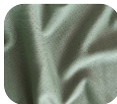
#16314783 | DRY POLIÉSTER VERDE