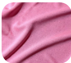
#16312622 | DRY POLIÉSTER ROSA CHICLETE