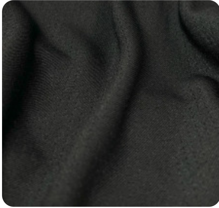
#1630032 | DRY POLIÉSTER PRETO