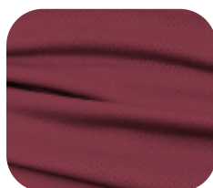
#229.1003 | DRY FLEX VERMELHO TERRA