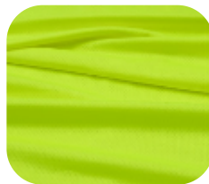
#22914542 | DRY FLEX AMARELO FLUORESCENTE