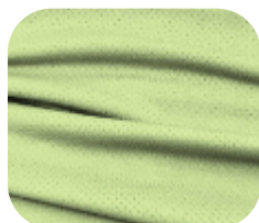
#229.4006 | DRY FLEX VERDE CHÁ