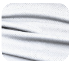
#229.0001 | DRY FLEX BRANCO