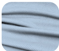
#229.5003 | DRY FLEX AZUL CÉU