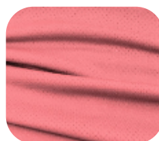
#229.2003 | DRY FLEX LARANJA CORAL