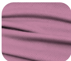
#229.7002 | DRY FLEX ROSA CHÁ