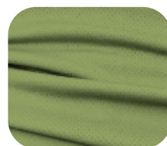
#229.4005 | DRY FLEX VERDE ABACATE