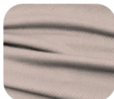
#229.9002 | DRY FLEX BEGE AREIA