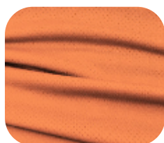
#229.2002 | DRY FLEX LARANJA TELHA

O DRY FLEX é uma malha leve, respirável e com elasticidade suave. Sua estrutura microperfurada favorece a ventilação e a rápida evaporação do suor, garantindo conforto e liberdade de movimento.