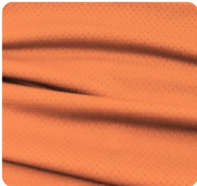
#229.2002 | DRY FLEX LARANJA TELHA