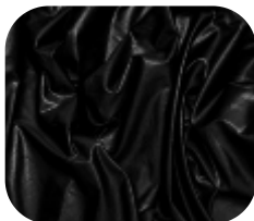
#2290032S | DRY FLEX PRETO CHINTS