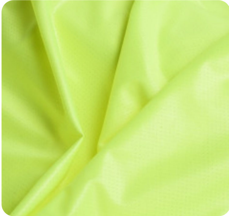
#22914542S | DRY FLEX AMARELO FLUORESCENTE CHINTS