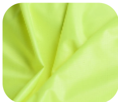
#22914542S | DRY FLEX AMARELO FLUORESCENTE CHINTS

O dry é uma malha mais esportiva, pois sua estrutura permite conforto mesmo com a alta transpiração. Possui durabilidade e caimento.