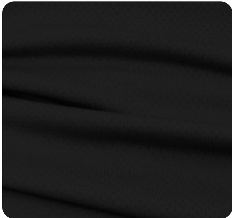
#229S.0032 | DRY FLEX PRETO CHINTS