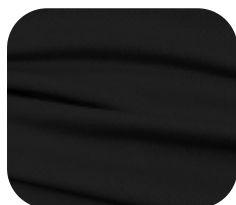
#229S.0032 | DRY FLEX PRETO CHINTS