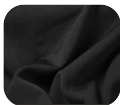
#4140032 | HELANCA BLAST PRETO

A Helanca Blast foi desenvolvida com o intuito de ter um similar do neoprene. É um produto flexível, com elasticidade e resistência.