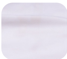
#4145032 | HELANCA BLAST OFFWHITE