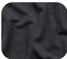
#5350032 | CREP POLIÉSTER COM ELASTANO PRETO