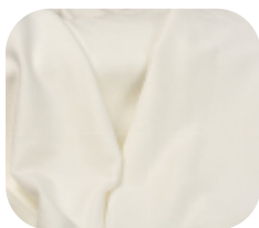
#5355032 | CREP POLIÉSTER COM ELASTANO OFFWHITE

Toque macio e caimento leve são as características do nosso Crep.