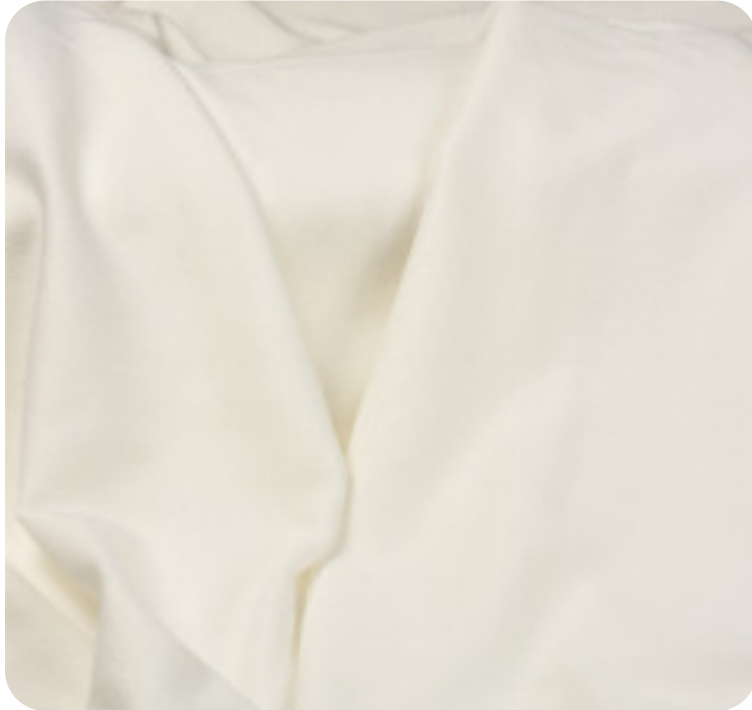
#5355032 | CREP POLIÉSTER COM ELASTANO OFFWHITE