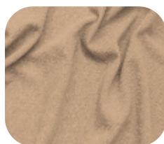
#590.9038 | CREP POWER BEGE CAMELO