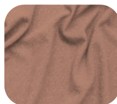
#590.9040 | CREP POWER MARROM CARVALHO