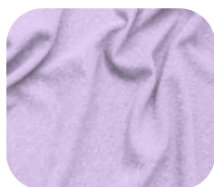
#590.6012 | CREP POWER LILÁS URBANO

O CREP POWER é uma malha com textura creponada marcante, que alia sofisticação e conforto. Sua superfície elegante garante caimento fluido, com elasticidade sutil que proporciona praticidade no uso.