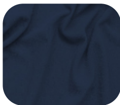
#590.5057 | CREP POWER MARINHO CREPÚSCULO