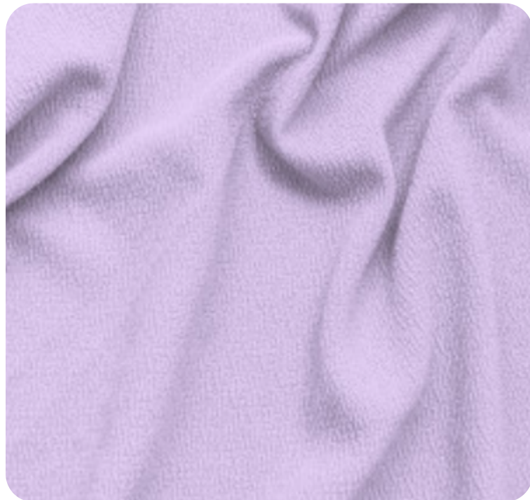
#590.6012 | CREP POWER LILÁS URBANO