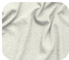
#590.0002 | CREP POWER OFFWHITE