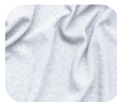
#590.0001 | CREP POWER BRANCO