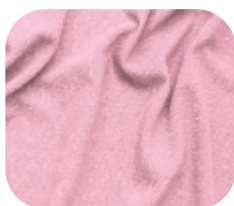
#590.7003 | CREP POWER ROSA BEBÊ