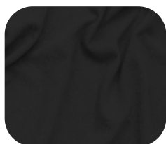
#590.0032 | CREP POWER PRETO