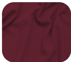
#590.1025 | CREP POWER BORDÔ AMARONE