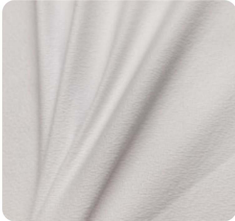
#5900001SUBLI | CREP POWER BRANCO PARA SUBLIMAÇÃO