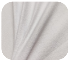
#5900001SUBLI | CREP POWER BRANCO PARA SUBLIMAÇÃO

Com elasticidade, caimento pesado, porém leve, o Crep Power é ideal para confecção de peças que fiquem mais justas ao corpo, como vestidos, saias e croppeds.