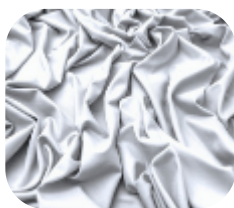
#63.0001 | CARMITAFLEX BRANCO