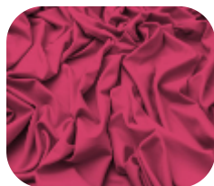
#63.7014 | CARMITAFLEX PINK VITA