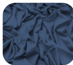
#63.5036 | CARMITAFLEX MARINHO AETER