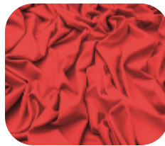
#63.2013 | CARMITAFLEX LARANJA FLUX