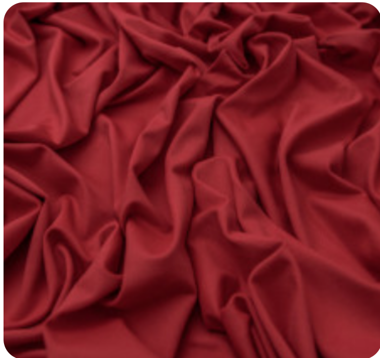
#63.1030 | CARMITAFLEX VERMELHO DIVA