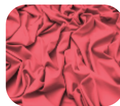
#63.7013 | CARMITAFLEX CORAL ROSSO