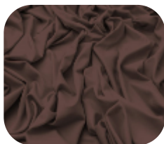
#63.9023 | CARMITAFLEX MARROM BARION