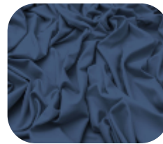
#63.5036 | CARMITAFLEX MARINHO AETER