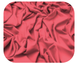
#63.7013 | CARMITAFLEX CORAL ROSSO