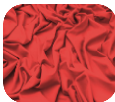
#63.2013 | CARMITAFLEX LARANJA FLUX