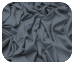
#63.8016 | CARMITAFLEX CINZA TITAN