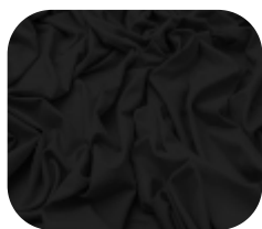
#63.0032 | CARMITAFLEX PRETO