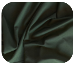
#67401455 | IVAFLEX VERDE