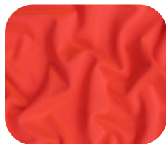
#6712298 | IVAFLEX LARANJA FLUOR