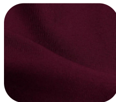
#6715376 | IVAFLEX MARCELIA