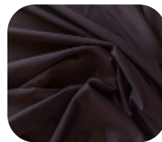
#676723 | IVAFLEX MARROM