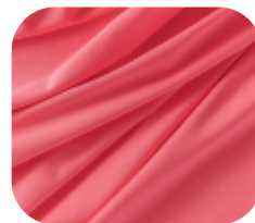
#673474 | IVAFLEX PINK FLUORESCENTE