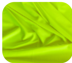
#675724 | IVAFLEX AMARELO CÍTRICO FLUORESCENTE