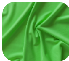
#675725 | IVAFLEX VERDE CÍTRICO FLUORESCENTE