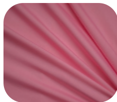
#675546 | IVAFLEX DOCE