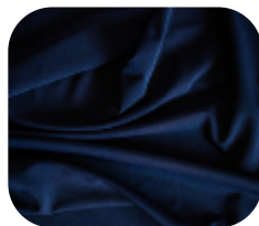
#6712714 | IVAFLEX MARINHO