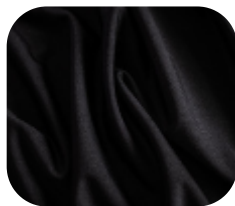
#670032 | IVAFLEX PRETO