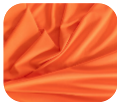
#675723 | IVAFLEX LARANJA FLUORESCENTE

O poliéster é flexível, durável, resistente e macio. Ideal para confecção de peças que requer liberdade de movimentos.