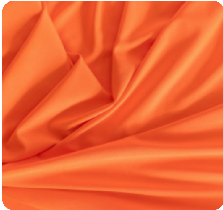
#675723 | IVAFLEX LARANJA FLUORESCENTE