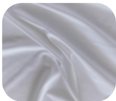
#675032 | IVAFLEX LAVADO