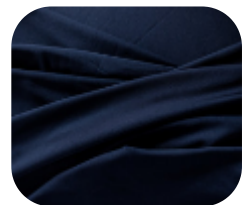
#6736139 | IVAFLEX MARINHO