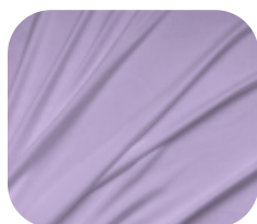
#71.6002 | SKINFLEX LÍLAS LAVANDA

O SKINFLEX é uma malha versátil e confortável, com toque macio, elasticidade equilibrada e proteção solar UV 50, garantindo segurança e bem-estar em qualquer ocasião.