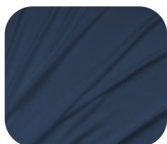
#71.5002 | SKINFLEX AZUL MARINHO