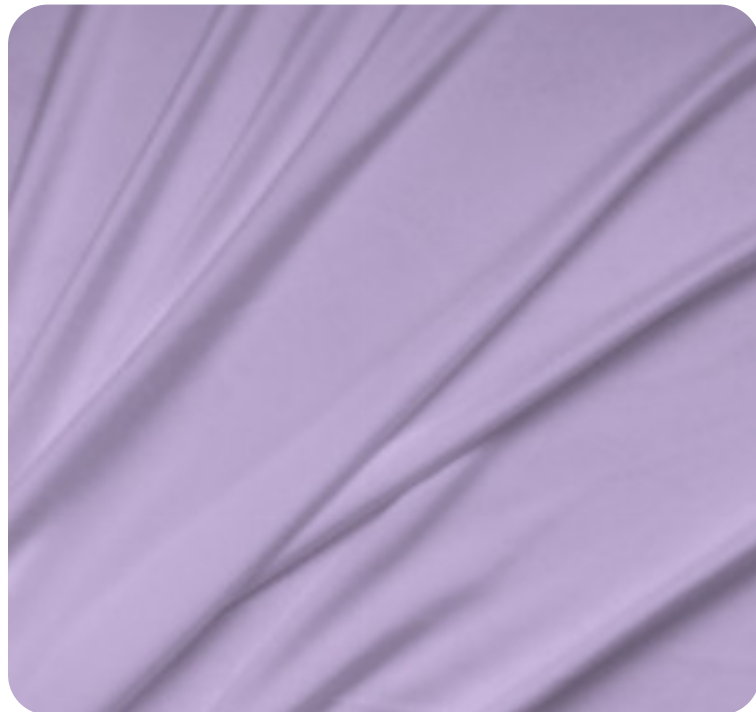
#71.6002 | SKINFLEX LÍLAS LAVANDA