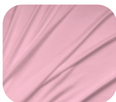
#71.7003 | SKINFLEX ROSA BEBÊ