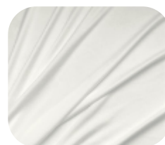
#71.0002 | SKINFLEX OFFWHITE