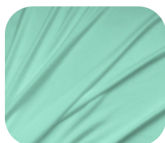
#71.4001 | SKINFLEX VERDE AQUAMARINE