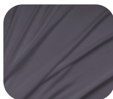
#71.8001 | SKINFLEX CINZA CHUMBO