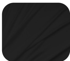
#71.0032 | SKINFLEX PRETO