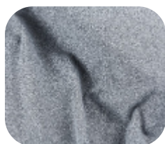
#73.0003 | SUPLEX POLIAMIDA AR MESCLA

Por ser uma cor versátil, o mescla vem ganhando espaço, fugindo das cores tradicionais sem perder a elegancia e dando um toque moderno as peças produzidas.