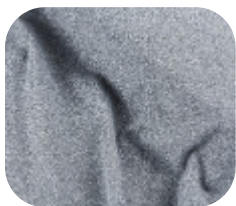
#731000 | SUPLEX POLIAMIDA MESCLA AR

Por ser uma cor versátil, o mescla vem ganhando espaço, fugindo das cores tradicionais sem perder a elegancia e dando um toque moderno as peças produzidas.