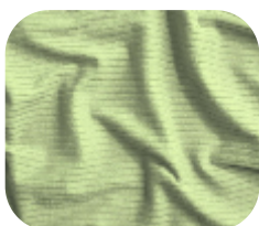
#786.4006 | CLAIR VERDE CHÁ