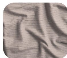
#786.9002 | CLAIR BEGE AREIA