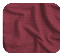
#786.1003 | CLAIR VERMELHO TERRA