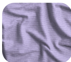
#786.6002 | CLAIR LÍLAS LAVANDA