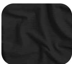
#786.0032 | CLAIR PRETO