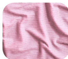
#786.7006 | CLAIR ROSA BAILARINA