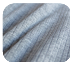
#786.0003 | CLAIR MESCLA