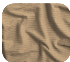
#786.9004 | CLAIR BEGE MACARRON

O CLAIR é uma malha canelada leve e versátil, com toque macio e caimento estruturado. Sua superfície texturizada garante um visual moderno, valorizando peças com elegância e conforto.