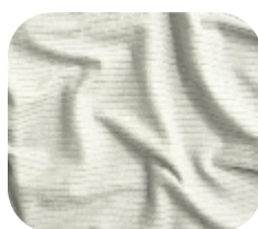
#786.0002 | CLAIR OFFWHITE