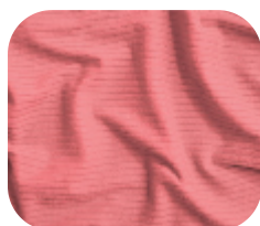
#786.2003 | CLAIR LARANJA CORAL