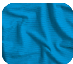
#786.5004 | CLAIR AZUL CAPRI