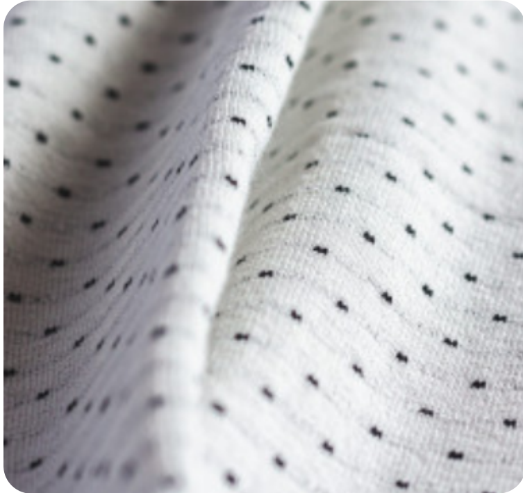
#8125032 | BALL OFFWHITE