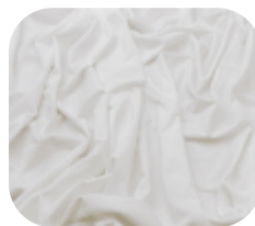
#9537209 | ITI POLI DESERTO