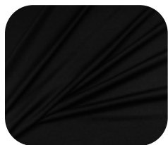
#950032 | ITI POLI PRETO

Com elasticidade e toque macio, nosso artigo Iti Poli é perfeito para sublimação (nas cores branco e deserto) e para confecção de peças leves.