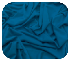
#95121270 | ITI POLI AZUL