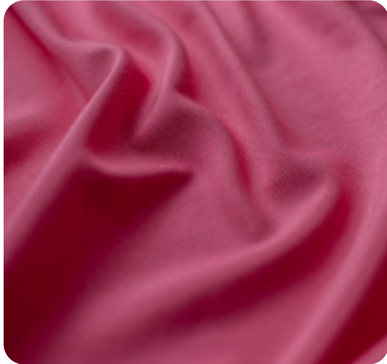
#9511743 | ITI POLI PINK