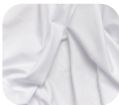
#950001 | ITI POLI BRANCO