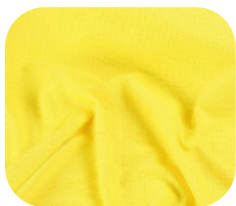
#9732269 | FREE FLEX AMARELO

O dry é uma malha mais esportiva, pois sua estrutura permite conforto mesmo com a alta transpiração. Possui durabilidade e caimento.