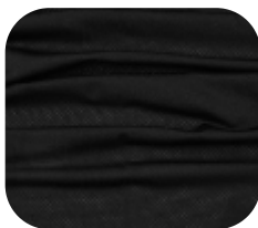
#970032 | FREE FLEX PRETO