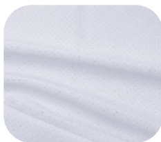
#970001 | FREE FLEX BRANCO