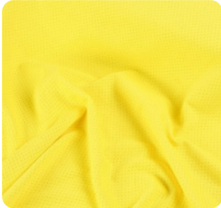
#9732269 | FREE FLEX AMARELO