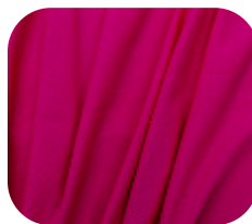
#9735406 | FREE FLEX PINK FLUORESCENTE